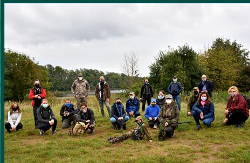
JESIENNY W UZARZEWIE

W WARSZTATACH BRAŁO UDZIAŁ ŁĄCZNIE 50 OSÓB.