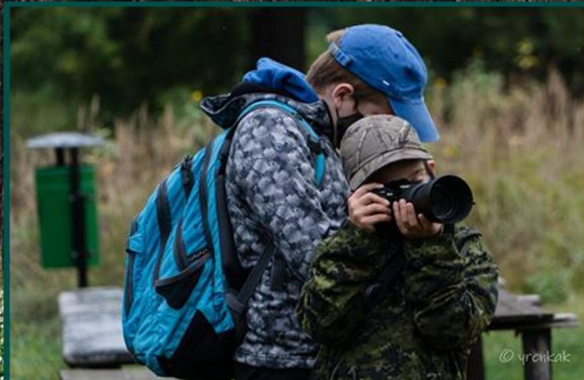
SPACER FOTO PUSZCZA ZIELONKA

PO ZLUZOWANIU ZAKAZÓW I OBOSTRZEŃ UDAŁO SIĘ ZREALIZOWAĆ: