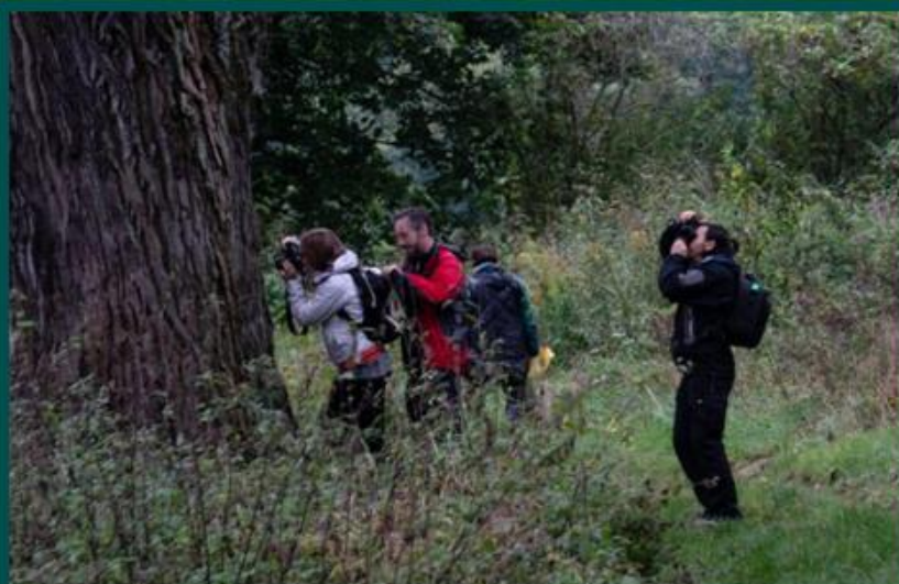
LETNI W OWIŃSKACH