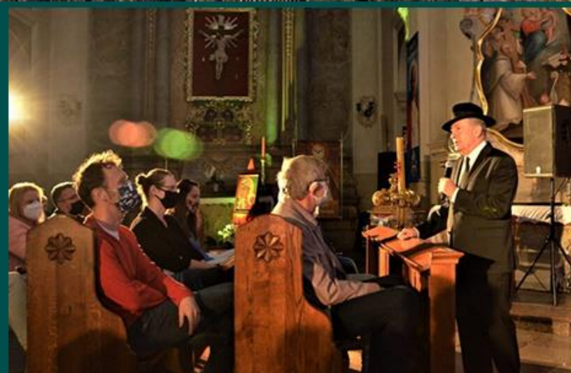
CYKL KONCERTÓW MUZYCZNA JESIEŃ W PUSZCZY ZIELONCE

Z ZAPLANOWANYCH WYDARZEŃ Z UDZIAŁEM CHĘTNYCH UCZESTNIKÓW I PUBLICZNOŚCI