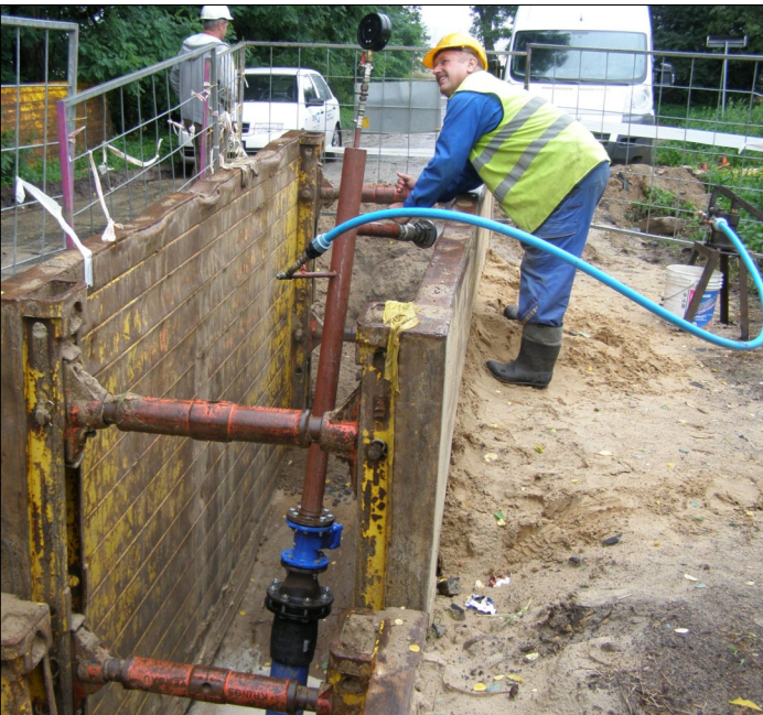
Próba szczelności rurociągu tłoczego (droga z Trzaskowa do drogi wojewódzkiej nr 196 - trasa do Poznania, gmina Czerwonak)

Szamba nieszczelne niestety się zdarzają, jednak w przypadku stosowania systemów kanalizacyjnych nie ma możliwości, aby coś wyciekło w ziemię. Dlatego przed uruchomieniem systemu rurociągi sprawdza się pod względem szczelności. Rurociągi tłoczne (ciśnieniowe) bada się manometrem, natomiast grawitacyjne zalewa się wodą i obserwuje czy nie ma przesiąków.