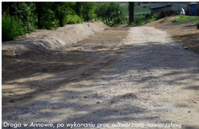
Droga w Annowie, po wykonaniu prac odtworzono nawierzchnię