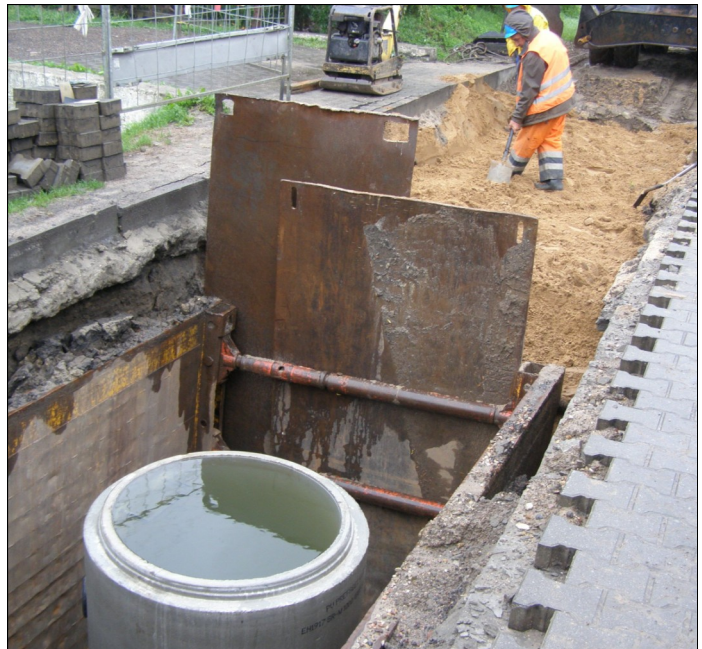
Próba szczelności rurociągu kanalizacyjnego grawitacyjnego w Bolechowie przy ul. Szkolnej, gmina Czerwonak

„Czysta Puszcza”, elektroniczny biuletyn dla uczestników przedsięwzięcia „Kanalizacja obszaru Parku Krajobrazowego Puszcza Zielonka i okolic”.