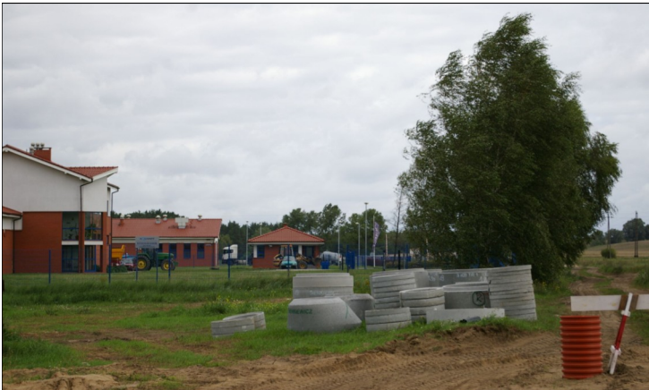
W Szlachęcinie budowany jest odcinek kanalizacji, który bezpośrednio łączyć będzie system z oczyszczalnią.

Wartość kontraktu: około 50 mln zł. Prace jeszcze się nie rozpoczęły.