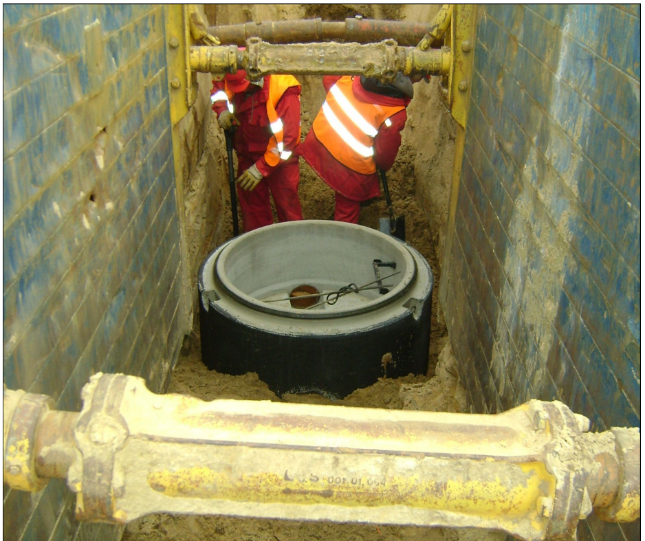
Budowa studni. Sławica ul. Gacka.