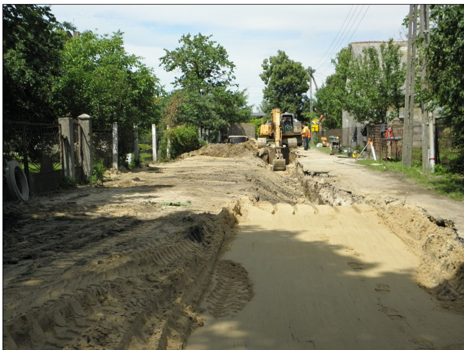
Prace w Długiej Goślinie, w rejonie kościoła (zadanie 6).