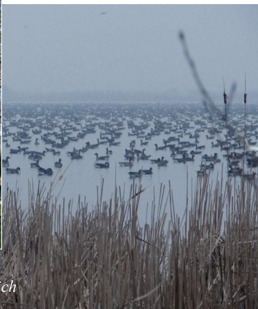
Gęsi na Stawach Kiszkowskich

świadczą bardzo liczne stanowiska archeologiczne kultury łużyckiej, a także tak znaczące budowle jak grodzisko wczesnośredniowieczne w Turostowie.