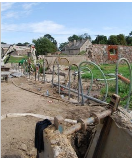
„Folwark” Szlachęcín. Odpompowywanie wody z wykopu przy pomocy igłofiltrów.

Przybylskiego, Zalasewo, Paczkowo (długość odcinka: 40,5 km; 14 przepompowni).