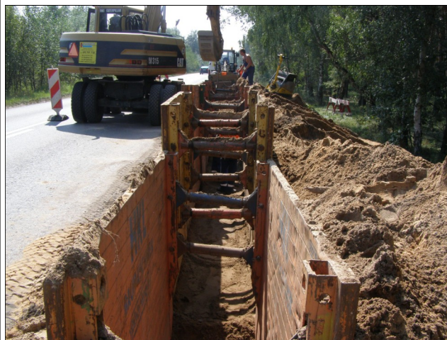
Ulica Obornicka w Bolechowie. Fotografia historyczna, wykop został już zasypany.

Gmina Pobiedziska, miejscowości: Pobiedziska, Jankowo, Jankowo-Młyn, Uzarzewo Hu-