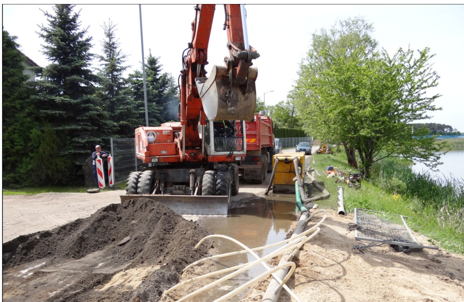
W maju kanalizację grawitacyjną budowano między innymi w Jerzykowie, w ulicy nad Zalasewem.

Plany na czerwiec zakładają budowę rurociągu grawitacyjnego w Swarzędzu, w ulicach: Kórnicka, Szmaragdowa, Staniewskiego, Średzka (596,5 m); w Zalasewie w ulicach: Plac Europejski, Irlandzka, Polska, Średzka, Węgierska, Szwajcarska, Kórnicka (769,5 m); w Paczkowie roboty powinny trwać na Rabowickiej, Zabłocie, Wiosennej, Polnej i Szparagowej (878,5 m). W sumie w ramach zadania 1 w czerwcu ma zostać wybudowana sieć kanalizacji grawitacyjnej o długości 2244 m.