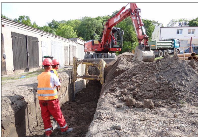
Budowa kanalizacji w Przebędowie, między blokami.